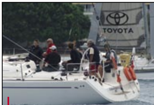
Internautic 6, 1er en temps réel monocoques

Quant aux skippers barbus et fatigués, mais heureux d'arriver, ils ne rêvaient que de douches !